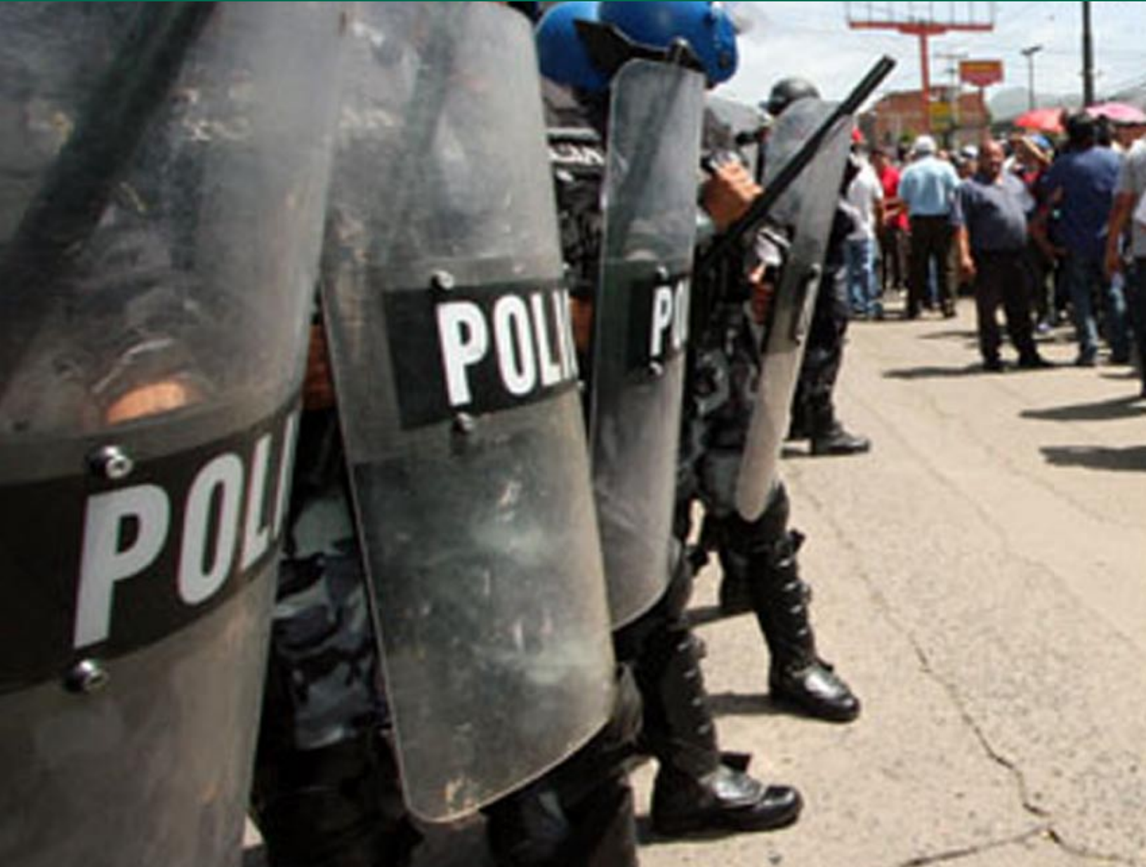
Fotos: James Rodríguez www.mimundo.org / diseño gráfico: gerardomonterroso.blogspot.com